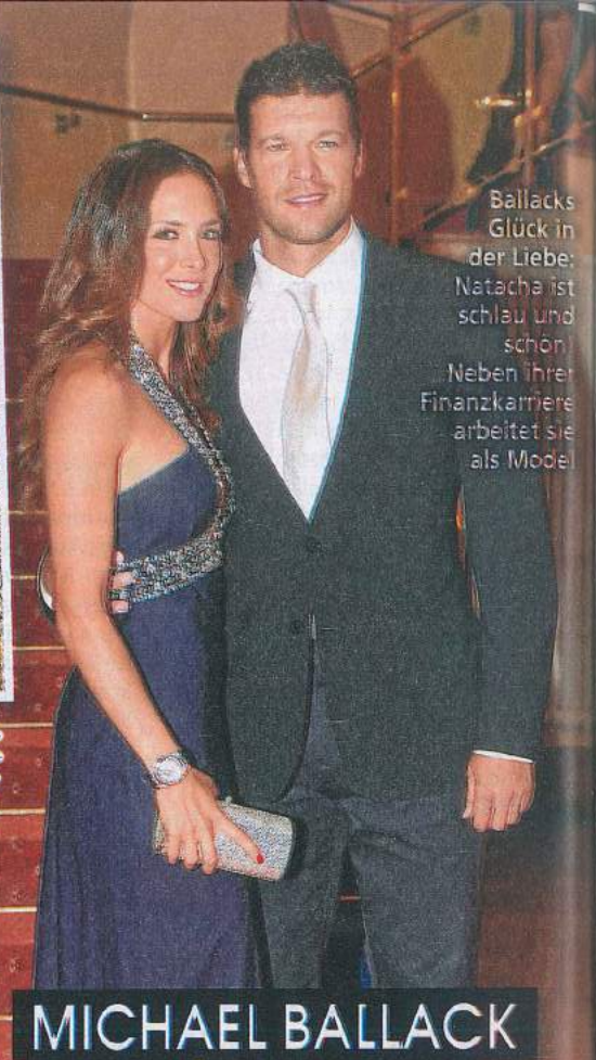
Ballacks Glück in der Liebe: Natacha ist schlau und schön! Neben ihrer Finanzkarriere arbeitet sie als Model.