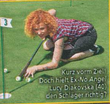
Kurz vorm Ziel! Doch hielt Ex-No Angel/Lucy Diakovska (40) den Schläger richtig?