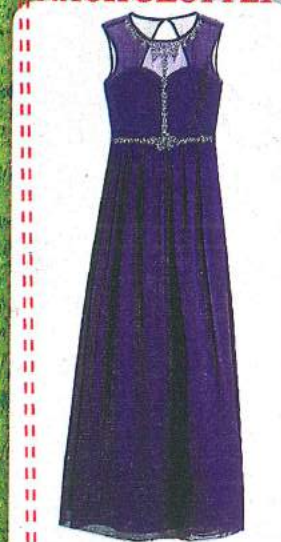
▲ Ballkleid mit Schmuckstein-Besatz in Navy, von Little Mistress, 124,95 €