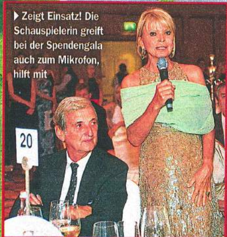
► Zeigt Einsatz! Die Schauspielerin greift bei der Spendengala auch zum Mikrophon, hilft mit