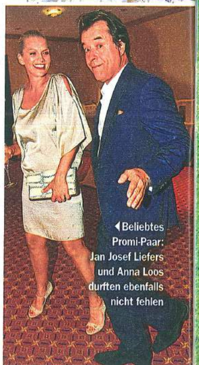
◀ Beliebtes Promi-Paar: Jan Josef Liefers und Anna Loos durften ebenfalls nicht fehlen