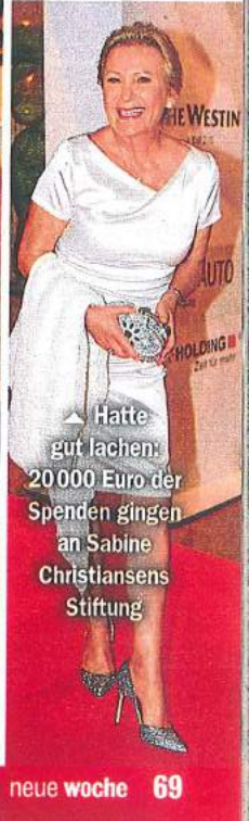
▲ Hatte gut lachen: 20 000 Euro der Spenden gingen an Sabine Christiansens Stiftung