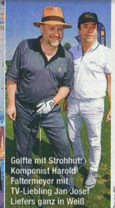
Golft mit Strohhut: Komponist Harold Faltermeyer mit TV-Liebling Jan Josef Liefers ganz in Weiß