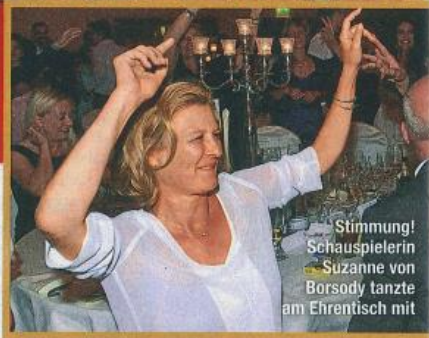
Stimmung! Schauspielerin Suzanne von Borsody tanzte am Ehrentisch mit