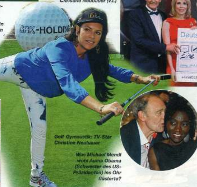
Golf-Gymnastik: TV-Star Christine Neubauer