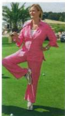
Ein bisschen Yoga vorm Abschlag? Suzanne von Borsody