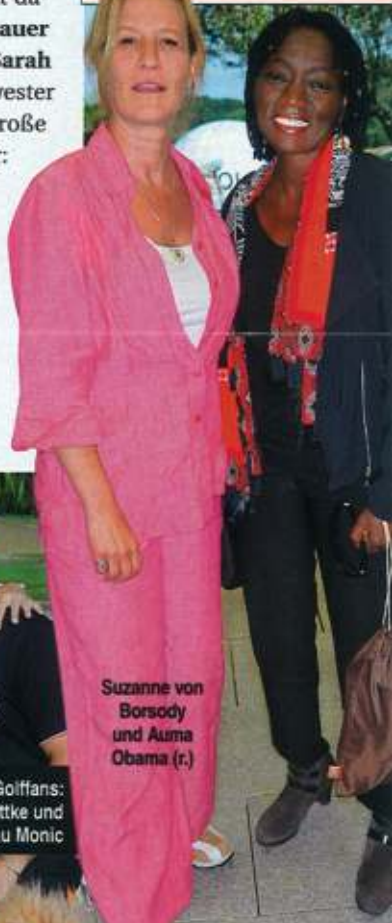
Suzanne von Borsody und Auma Obama (r.)